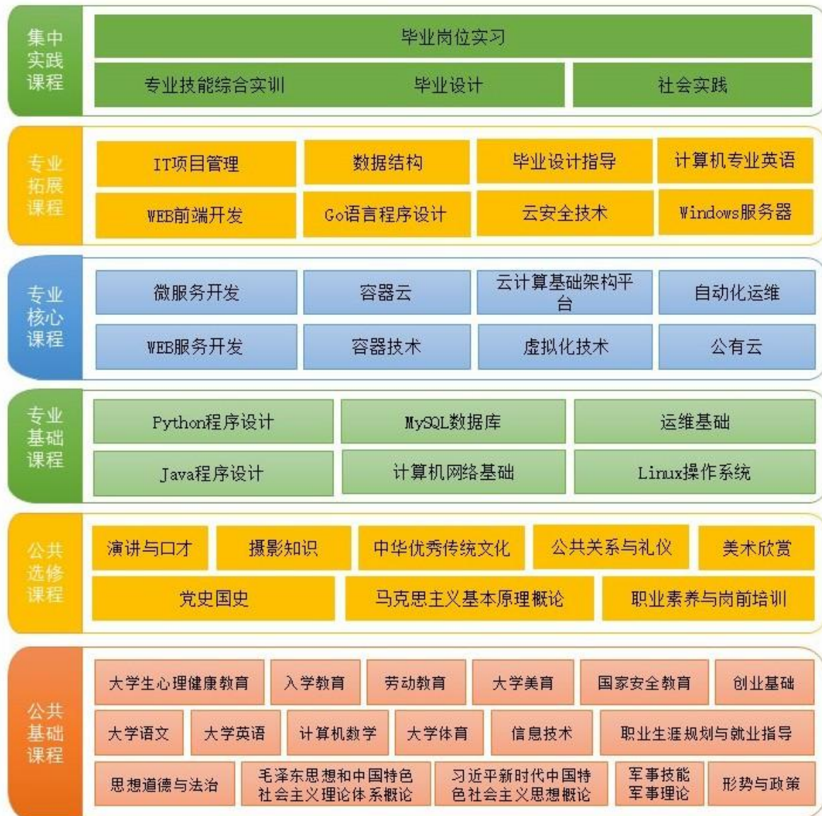
图 2 课程体系

律和认知学习规律，设计课程体系。全面贯彻“三全育人”改革实施方案，把立德树人融入思想道德教育、文化知识教育、技术技能培养、社会实践教育各环节。