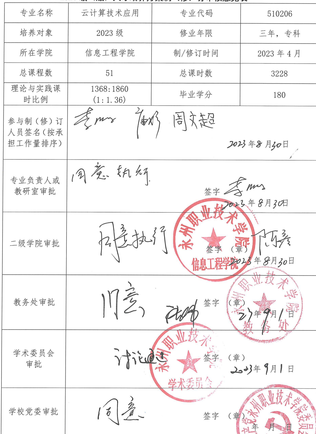
2023级（版）人才培养方案制（修）订审核意见表